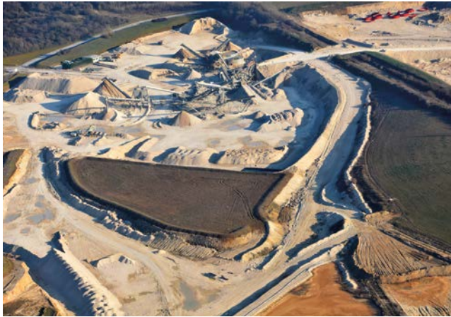
Vue générale : installations et réaménagement

La carrière de Prasville, exploitée par la Société des Matériaux de Beauce, s'étend aujourd'hui sur 354 hectares dont 231 ha exploitables et extrait chaque année 800 000 tonnes de calcaire. Ces derniers, destinés au marché local et d'Île-de-France, rentrent dans la composition du béton et peuvent servir de gravas routières.