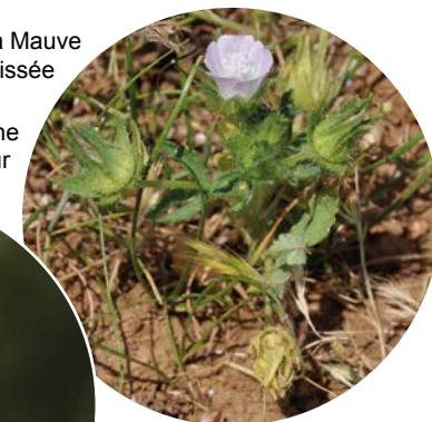
La Pie-Grèche écorcheur