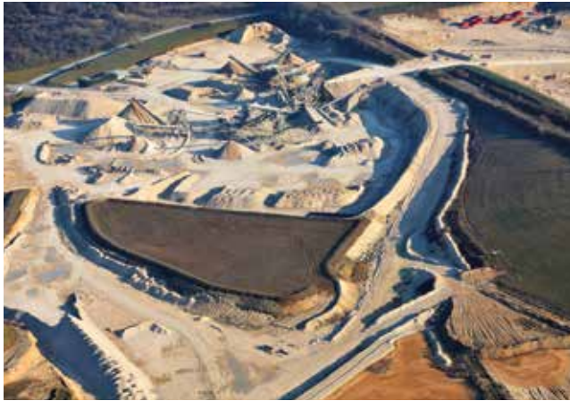
Vue générale : installations et réaménagement

La carrière de Prasville, exploitée par la Société des Matériaux de Beauce, s'étend aujourd'hui sur 354 hectares dont 231 ha exploitables et extrait chaque année 800 000 tonnes de calcaire. Ces derniers, destinés au marché local et d'Île-de-France, rentrent dans la composition du béton et peuvent servir de graves routières.