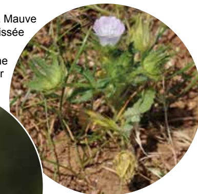
La Pie-Grèche écorcheur